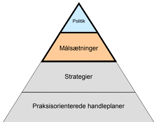
Figur 1: Ramme for arbejdet med børn og unge

Efter indledningen af politikken beskrives mission, vision og værdier samt kendetegn for arbejdet med børn og unge i Næstved Kommune. Herefter kommer en karakteristik af politikens målgrupper, som danner baggrund for kommunens målsætninger og beskrivelserne af ”Derfor gør vi...”. Politikken består af de to øverste lag i trekanten i figur 1 og sætter hermed de overordnede rammer for de enkelte afdelingers og virksomheders arbejde med børn og unge. Indholdet i de to nederste lag i trekanten er op til de enkelte afdelinger og virksomheder at udfylde med baggrund i deres forskellige forudsætninger og faglige praksis.