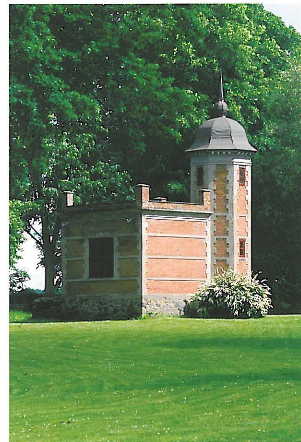
Grundtvigs pavillon Venligheden.

1994-98 erhvervede Næstved Kommune Rønnebæksholm. Siden har Kommunen gennemført en renovering af hovedbygningen med henblik på stedets nye funktion som Kunst- og Kulturcenter.