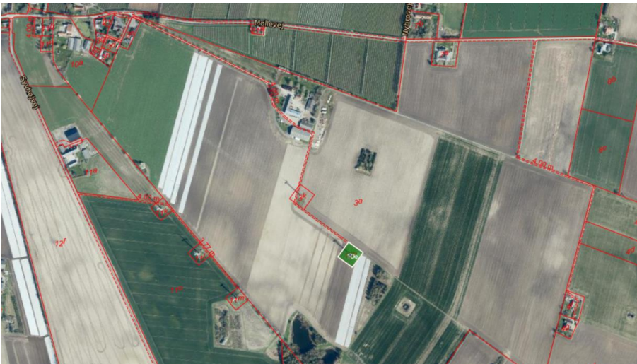
Matriklens placering sydøst for Tonemark markeret med grønt