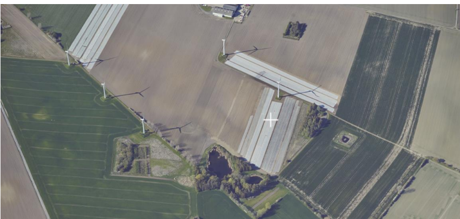
Skråfoto af området med møllerne. Møllen (og dens matrikel) ses lige over det hvide kryds.