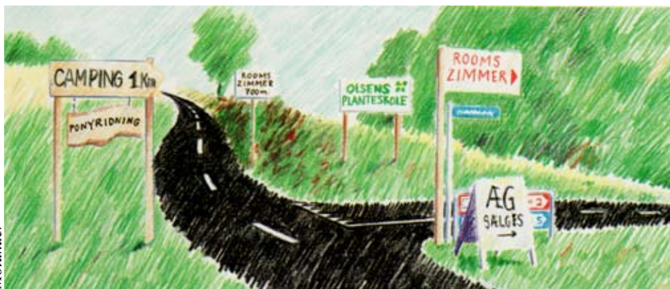
Ikke kaos eller store reklamer i det åbne land