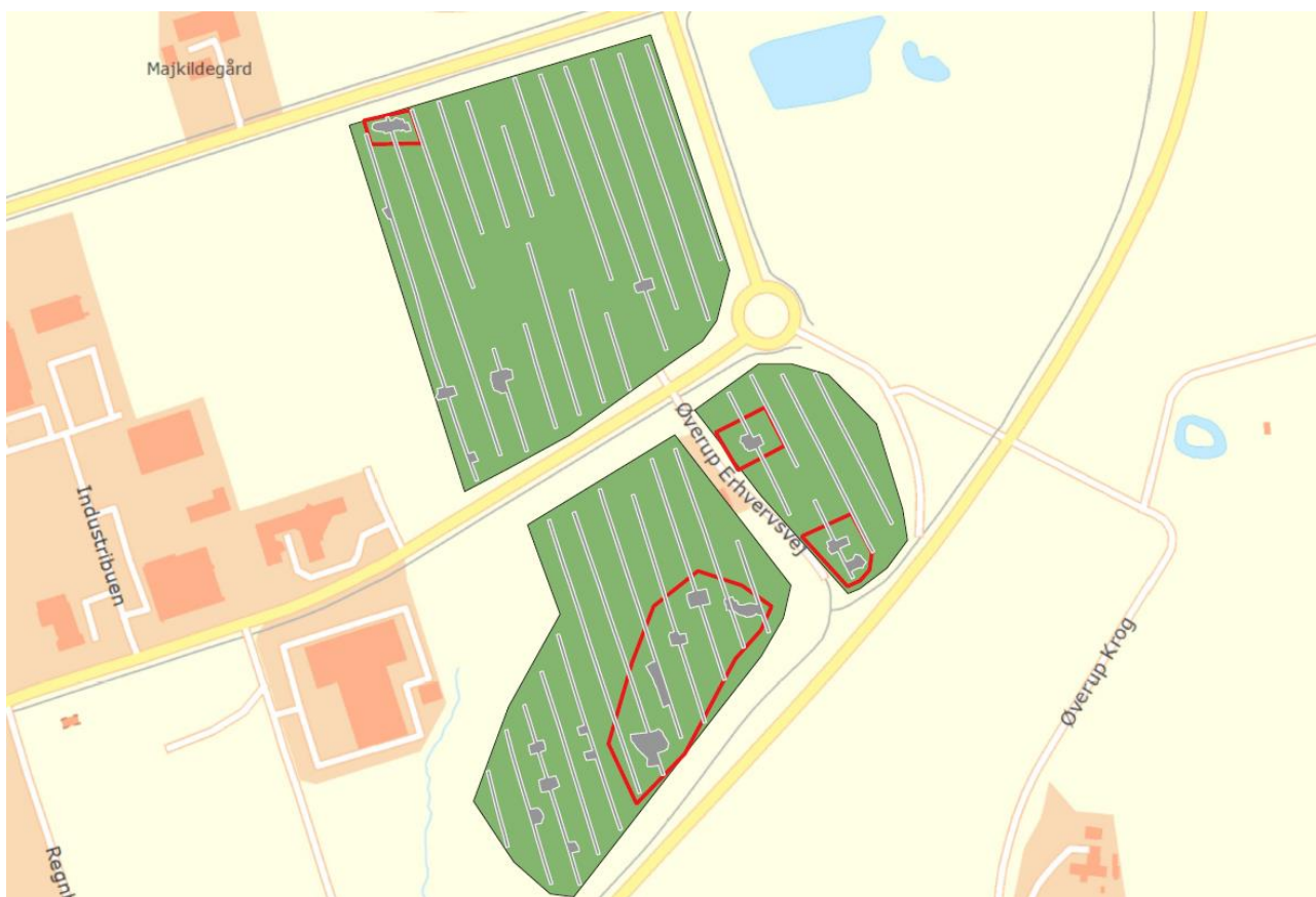
Figur 1: Oversigtskort med markering af forundersøgte arealer (grønne arealer) og udgravede felter (røde omrids).

Museum Sydøstdanmark skal hermed meddele, at den arkæologiske udgravning og forundersøgelse på området ved Egebjerggård er afsluttet. Arealet der dækker ca. 78.400m 2 kan frigives til forestående anlægsarbejde.