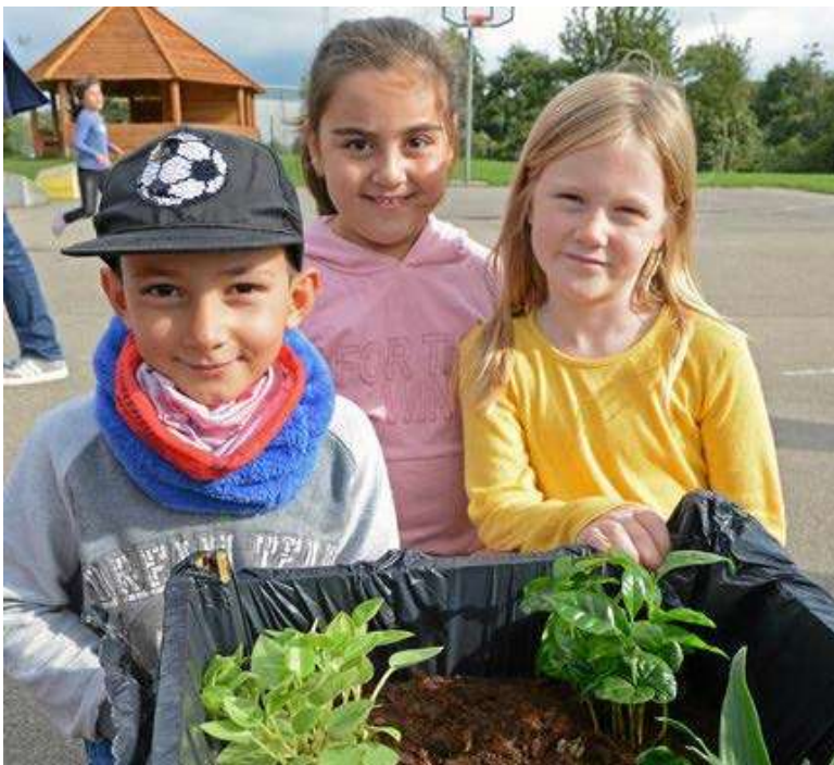
Biodiversitet i skolegården

Både lærere og pædagoger kunne efterfølgende berette om dybt engagerede og motiverede børn, som viste stor interesse for arbejdsformen, ideudviklingen og produktudviklingen. Elever som blev nysgerrige, fordi de kunne relatere sig til udfordringen, elever som viste stort gå på mod, og elever, som var særligt optagede og kreative i realiseringsfasen. Forløbene engagerede alle elever.