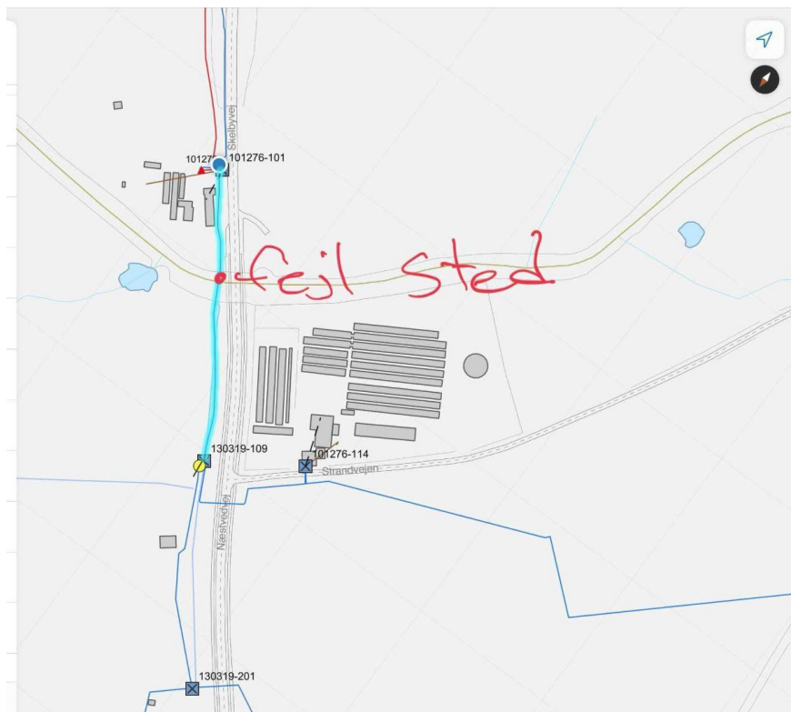
Kort 3: Angivelse af punkt på ledning for fejl (bemærk kort er sydvendt)

vandløbsregulering og -restaurering m.v., nr. 834 af 27. juni 2016 § 9, stk. 2.