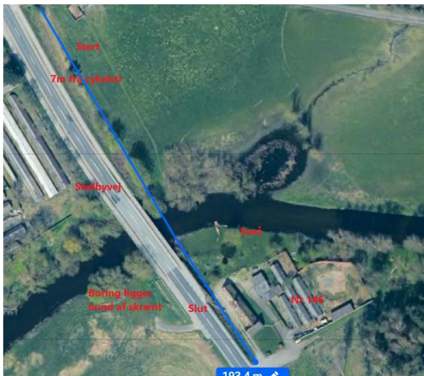
Kort 2: Detajlkort med angivelse af vandløb samt krydsningspunkt (fra ansøger)