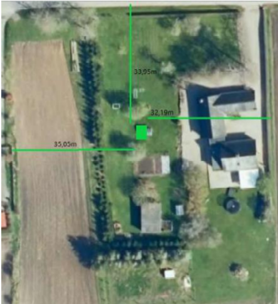
Situationsplan, der viser shelterets placering, der her er vist med grøn firkant, og afstand til skel. Fra ansøgningsmaterialet.