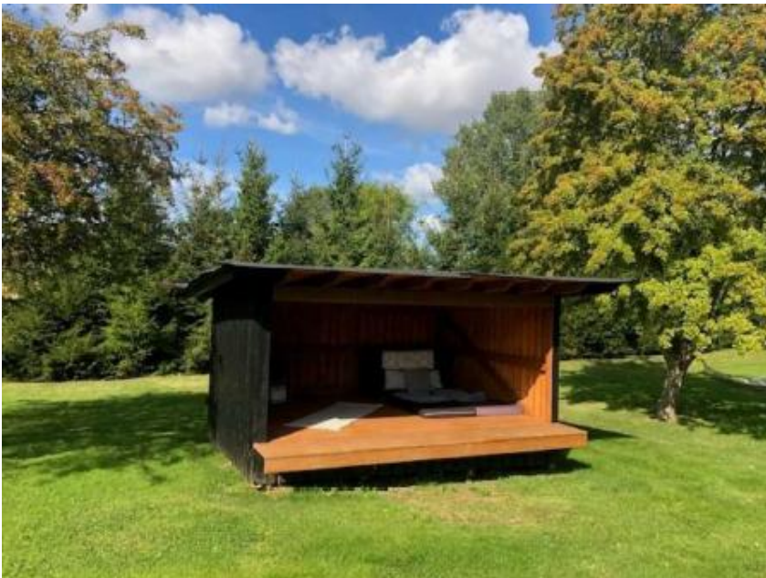
Foto af sheltere. Fra ansøgningsmaterialet.