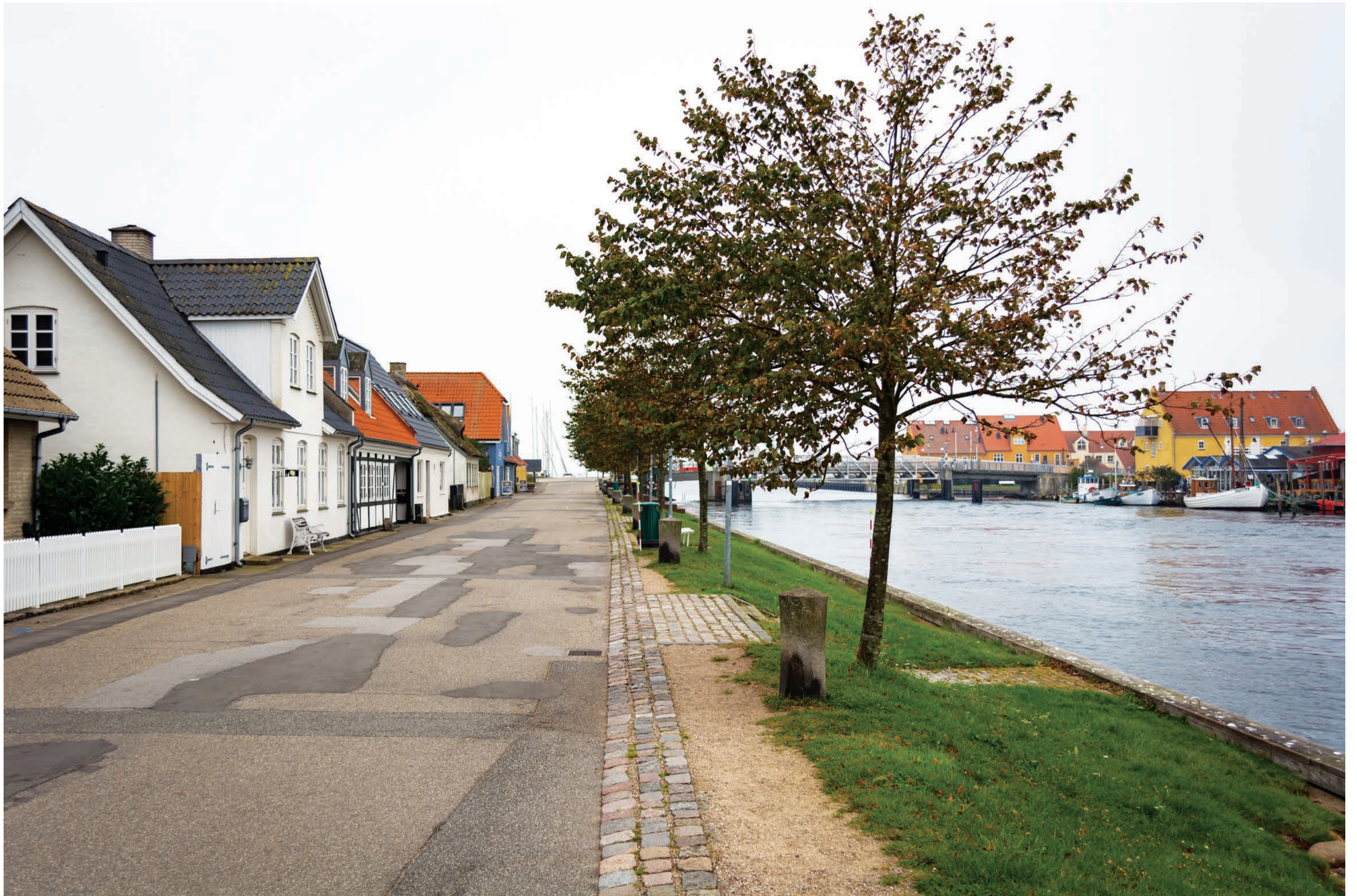
Fotostandpunkt 3-DSC_0157- Kig mod vest ned ad "Ved Broen" 26. september 2019 - Brændvidde 24 mm.