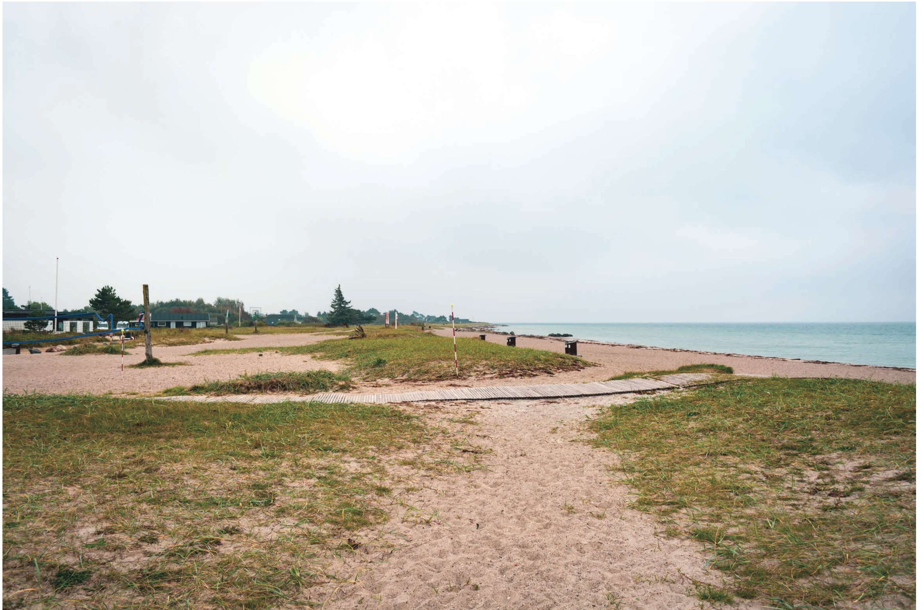
Fotostandpunkt 2-DSC_0149- Kig fra Søborggård Hestecenter 12 september 2019 - Brændvidde 24 mm.