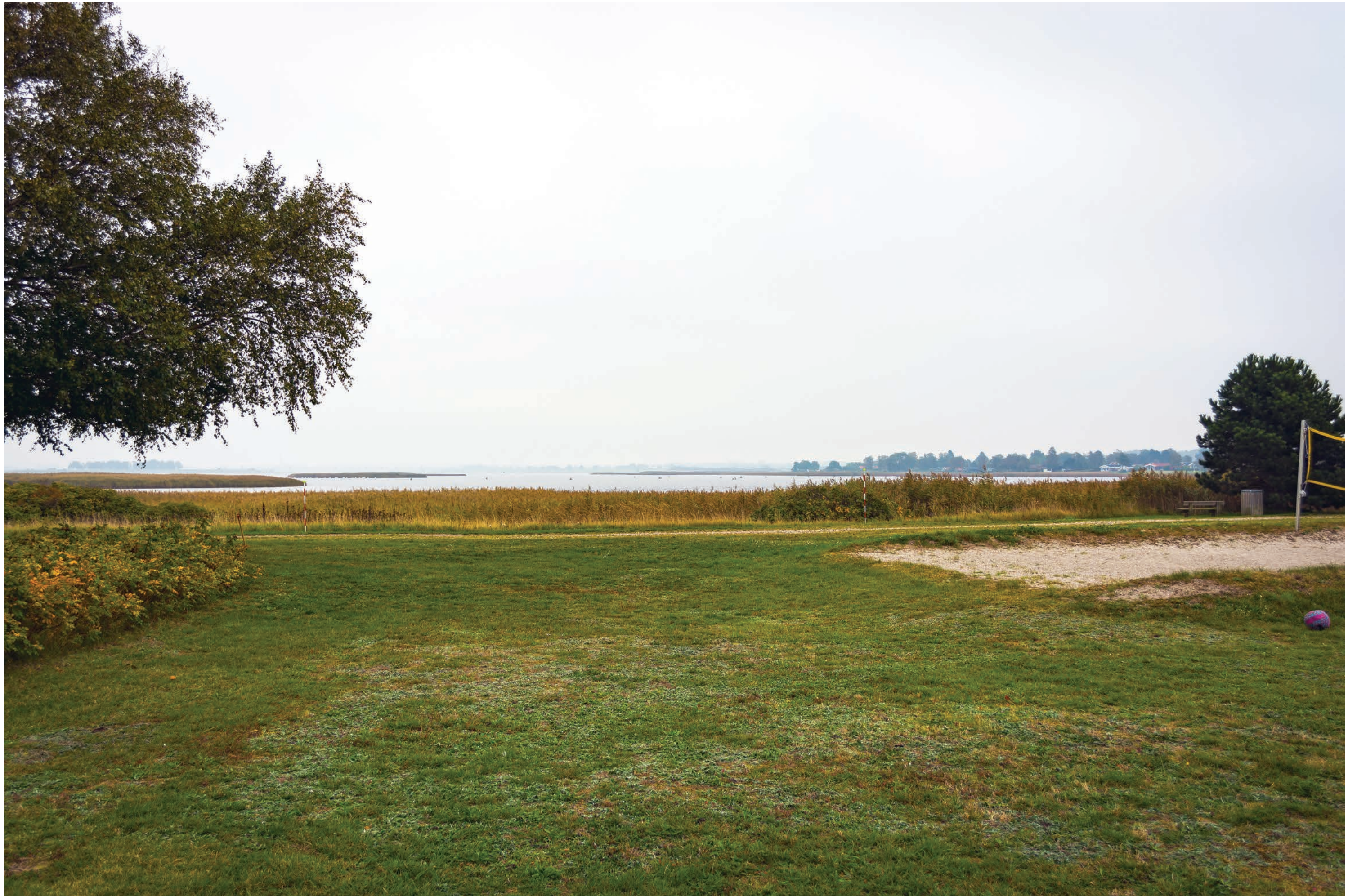
Fotostandpunkt 4-DSC_0167- Kig fra Fjordhusene mod nord. 26. september 2019 - Brændvidde 37 mm.