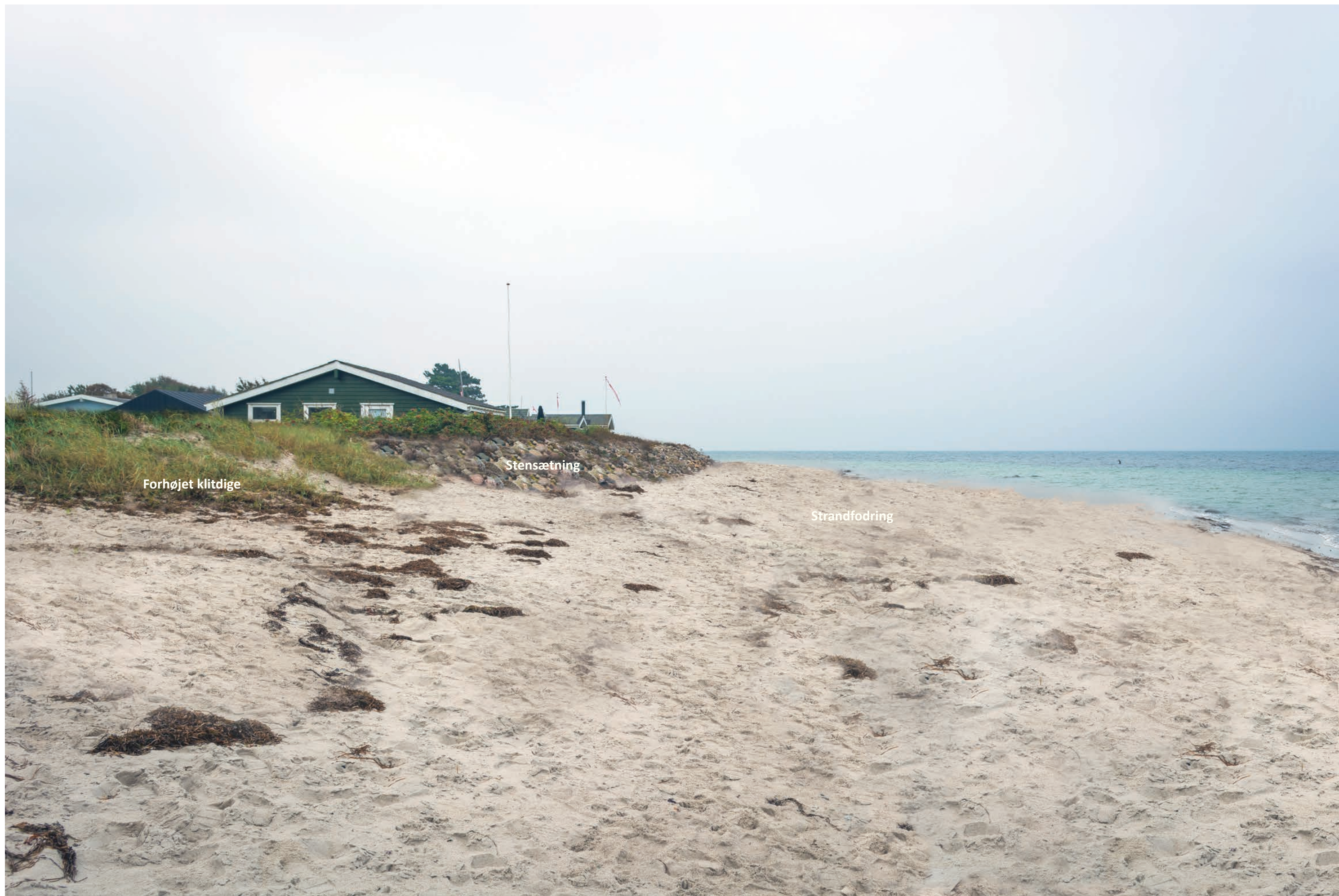
Fotostandpunkt 1 - Visualiseringen viser forhøjelse af klitdige og overgangen til skråningsbeskyttelsen samt nyanlagt strandfodring (sandet vil erodere væk indtil ny strandfodring hver 3. år).