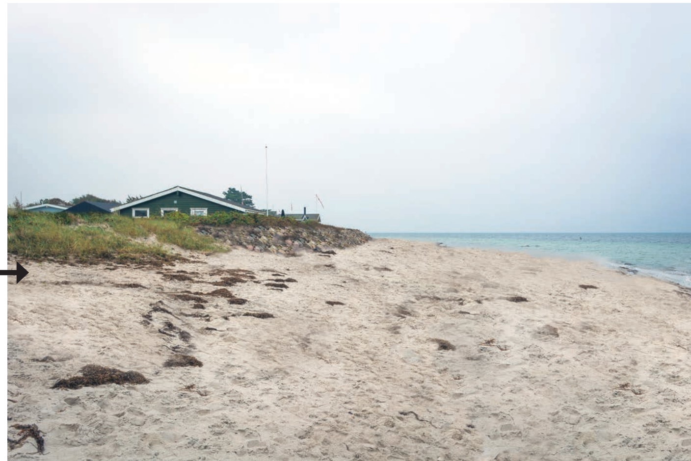
Naturalistisk udgave af stranden med forhøjet dige og umiddelbart efter strandfodring.