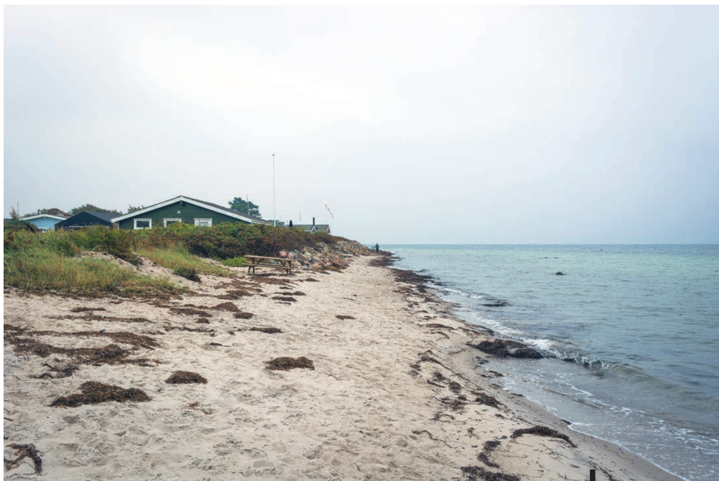
Eksisterende forhold (tennisboldene er referencepunkter der indmåles med GPS)