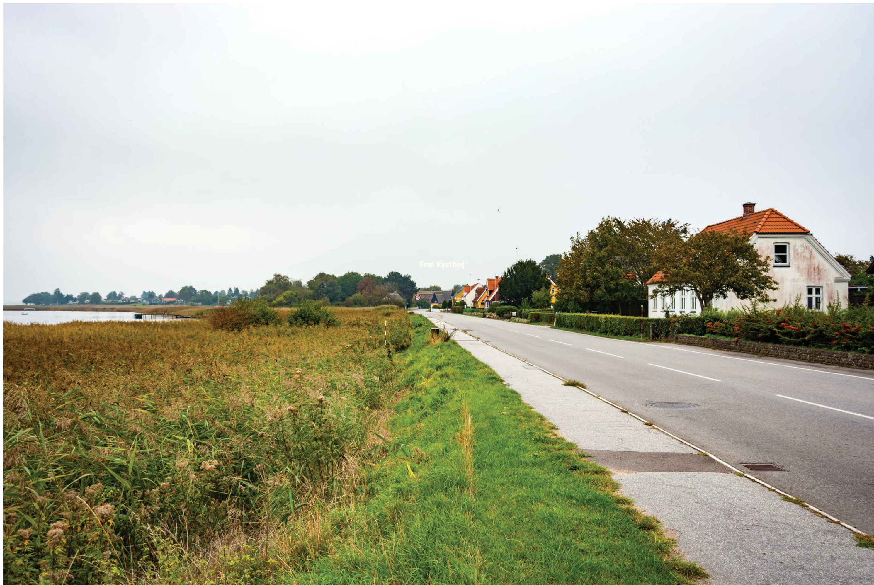
Fotostandpunkt 6-DSC_0187- Kig mod nord ad Enø Kystvej. 26. september 2019 - Brændvidde 24 mm.