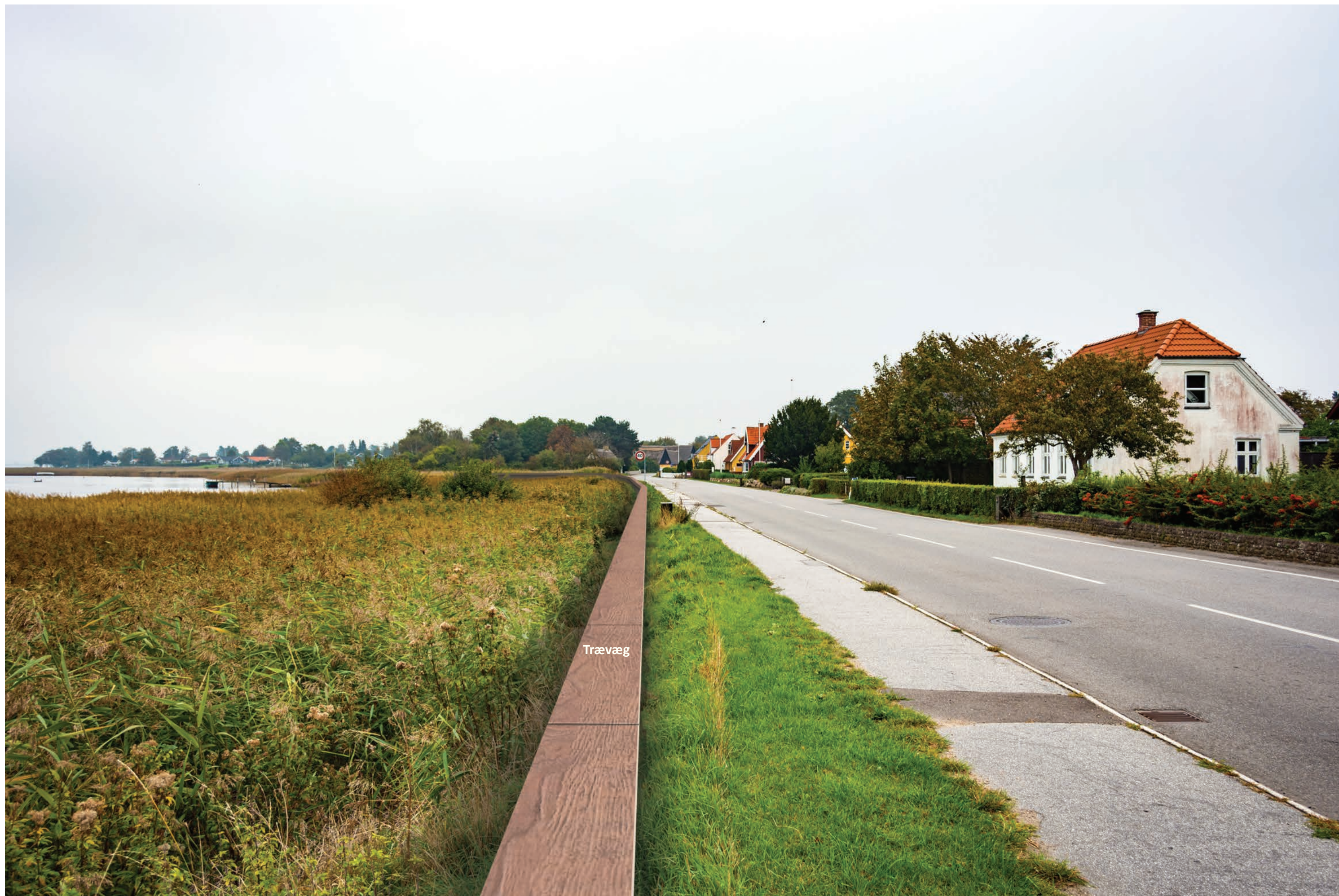
Fotostandpunkt 6 - Visualisering af dige og trævæg i kote 2,3 langs Enø Kystvej