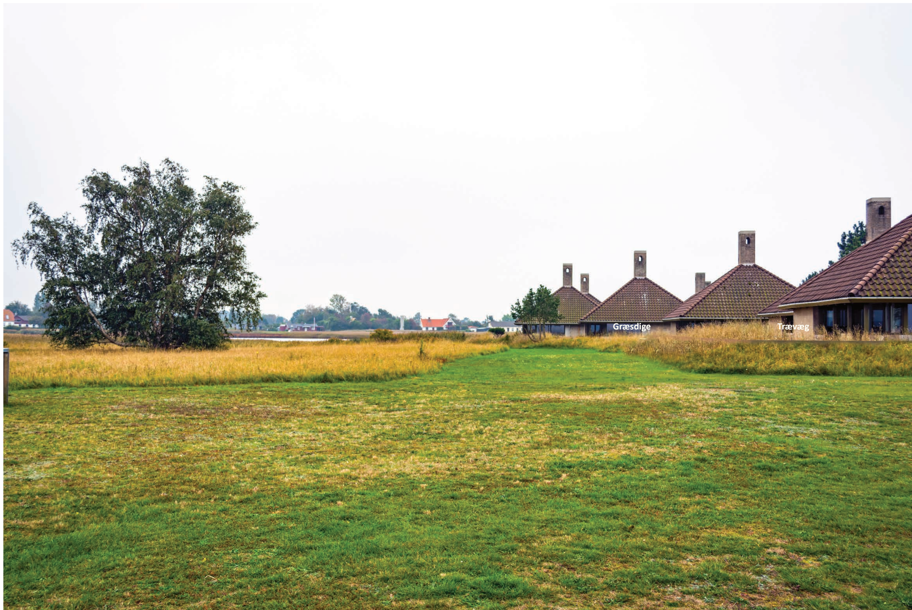
Fotostandpunkt 5 - Visualisering af Hovedprojekt: Digeforhøjelse med indbygget trævæg i kote 2,5