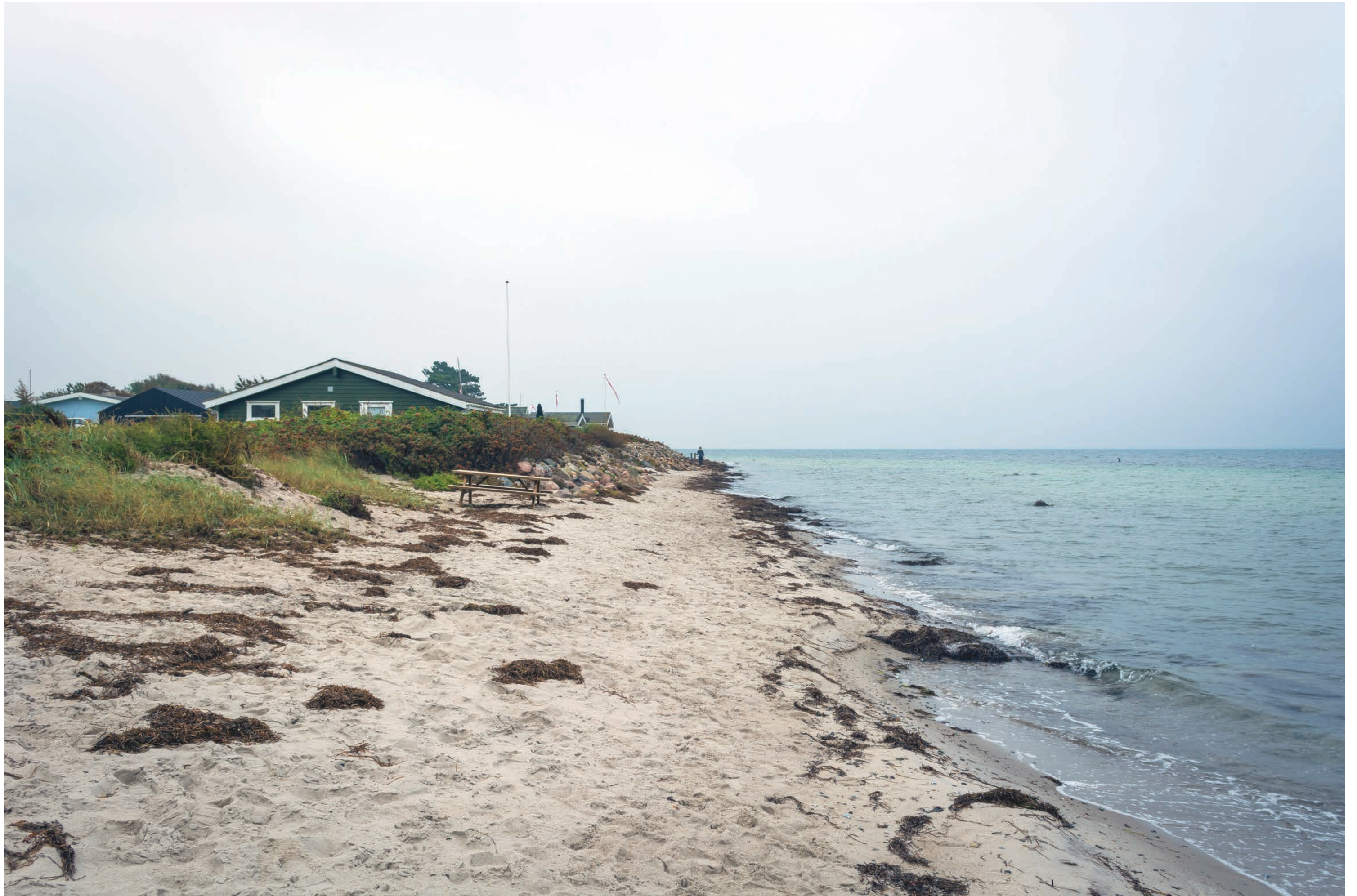
Fotostandpunkt 1-DSC_0188- Kig fra stranden ud for Lungskyst, hvor de første sommerhuse der ligger helt ud til vandet er. 26 september 2019 - Brændvidde 24 mm.