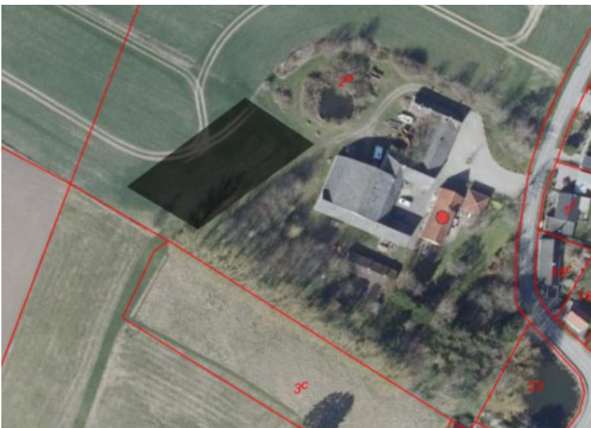
Luftfoto med angivelse af placeringen af ridebanen ved med grå polygon. Fra ansøgningsmaterialet.

Luftfoto med angivelse af placering af ridebanen er vist nedenfor.