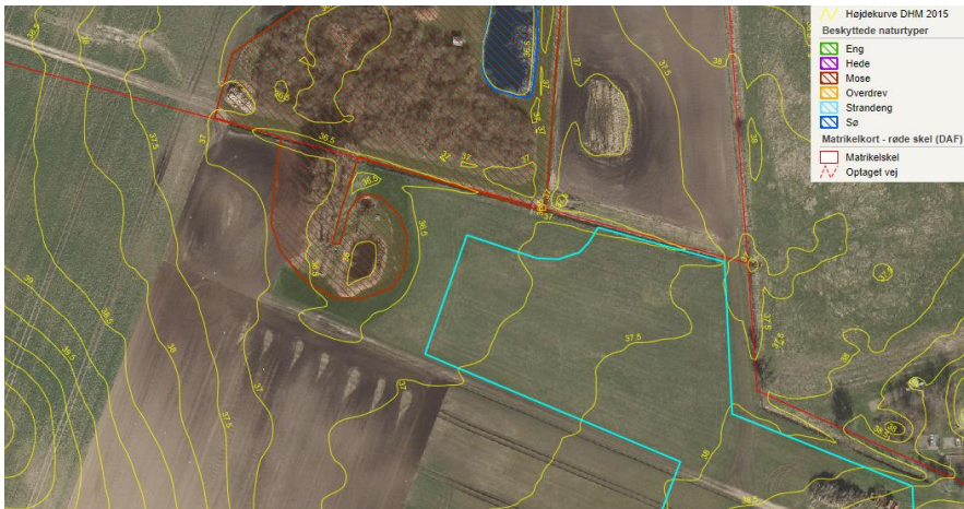
Naturtyper tæt på skovrejsningen vist med turkis

interesser, kommunen skal varetage omkring naturtyper beskyttet efter naturbeskyttelseslovens § 3.