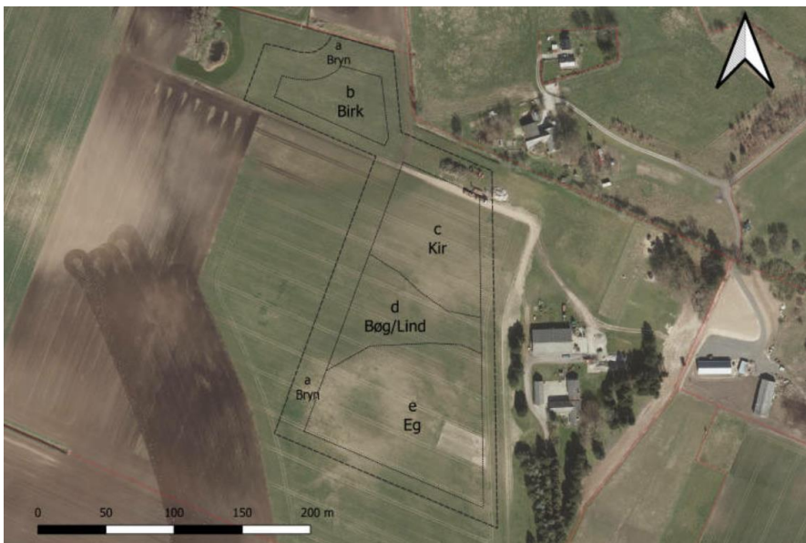
Skovkort - fra ansøgning

Skovrejsningen placeres på mark i omdrift omgivet af mark og haver. Området, skoven ønskes placeret i, er i kommuneplanen registreret som "jordbrugsområde" og "naturbeskyttelsesområde", hvor der kan skabes sammenhæng mellem eksisterende natur. Skovrejsning vil ikke være i konflikt med dette.