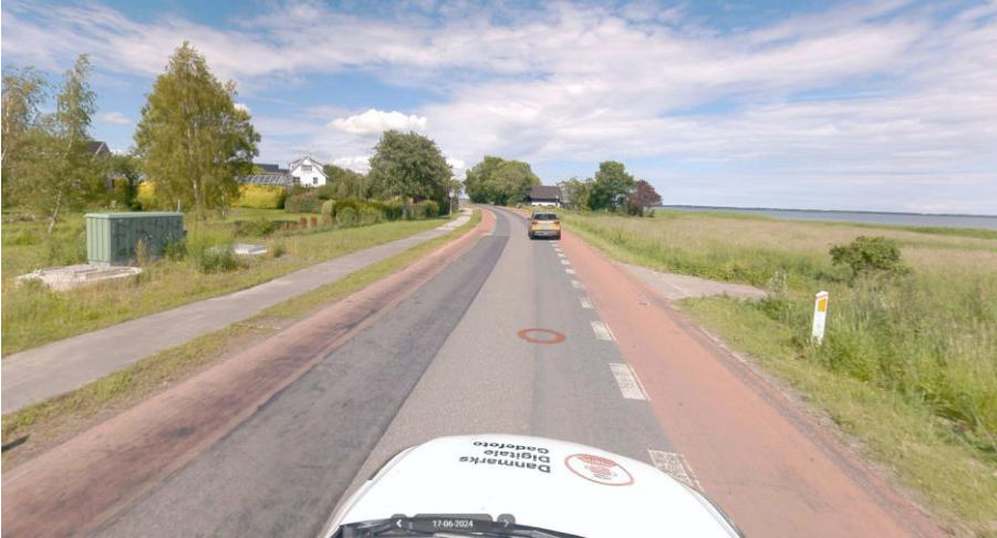
Etableret pumpestation 'delnr. 8' ses her på gadefoto til venstre i billedet på den vestlige side af Strandvejen, matr.nr. 7000c, Bredeshave, Snese.