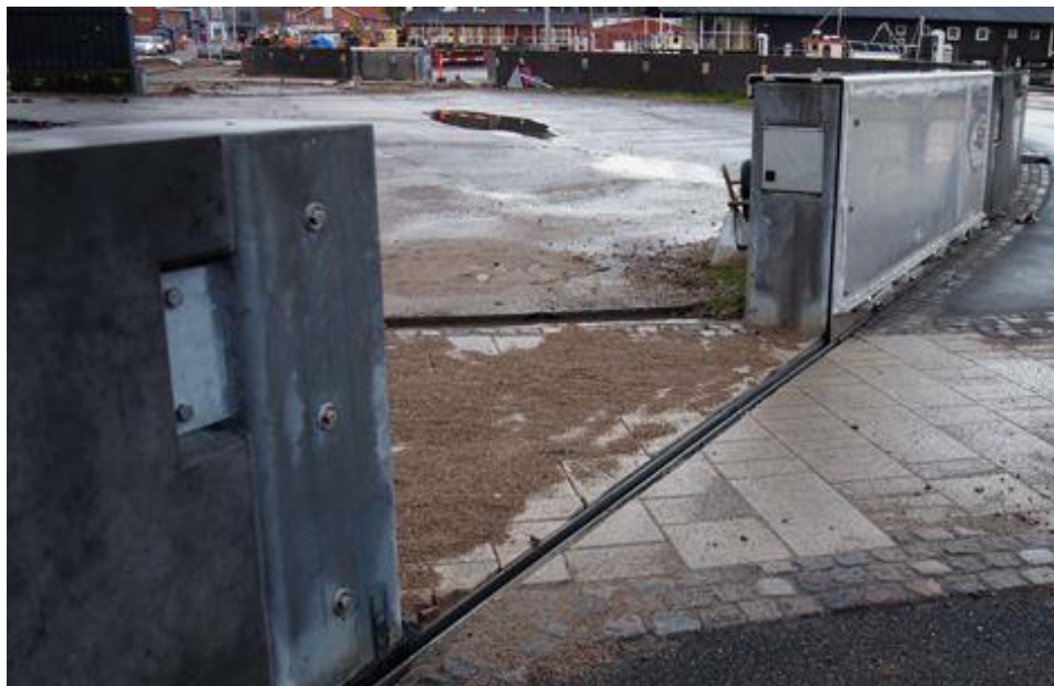
Figur 1.2: Højvandsmur i Lemvig udført i beton med påmonteret højvandsskot.

Den umiddelbare fordel ved højvandsmure er deres lille fodaftryk, men murene skal konstrueres rigtigt for at kunne modstå vandtryk og bølger. Højvandsmure er relativt bekostelige og mere skrøbelig end diger især fordi de er svære og dyre at reparere. Trævægge kræver desuden en del vedligeholdelse og levetiden er kortere end for diger. Betonvægge som vist på Figur 1.2 ovenfor har en længere levetid en trævægge.