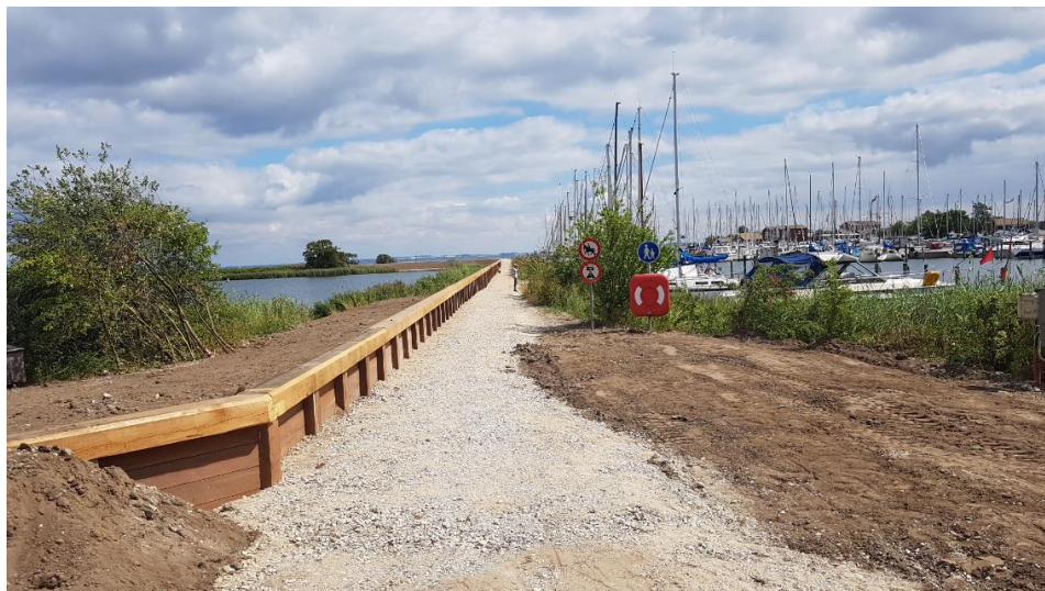
Figur 1.3: Eksempel på højvandsmur i Nivå udført som københavnerveg i azobé (stolper og flager) med topafdækning i lærk.

Lange flade vejbumper kan også anlægges, således at vejen i sig selv indgår i beskyttelsen.