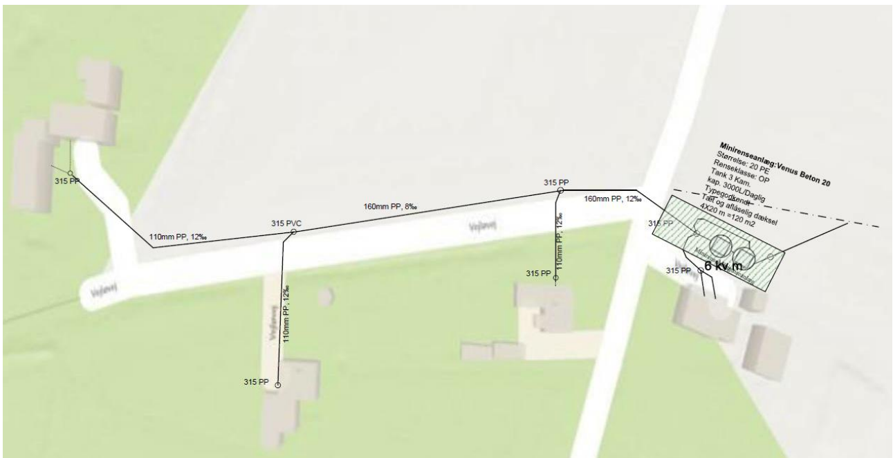
Kloaktegning fra ansøgning

Spildevandsanlægget vil ligge inden for kystnærhedszonen. Formålet med kystnærhedszonen er at beskytte de danske kystlandskaber mod unødige ændringer. Etablering af det nedgravede minirenselanlæg til 20 PE betragtes ikke i strid med udpegningen.