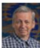
Ole Hardt Den Filippinske klub