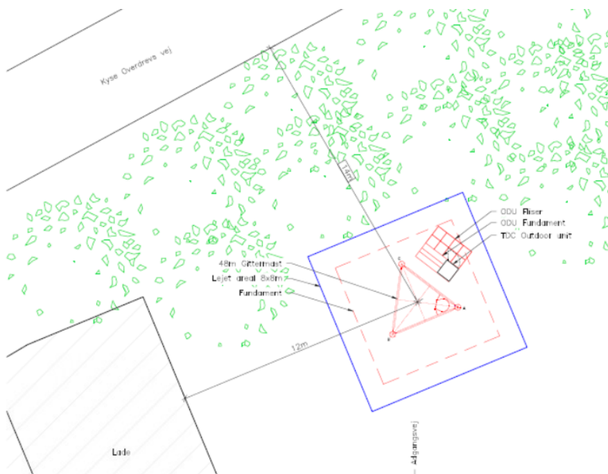
Kyse Overdrevs Vej 37, 4700 Næstved – placering af ny antennemast

På sitet opføres en 48 meter høj gittermast med mulighed for opsætning af antennepaneler fra flere udbydere samt opførelse af teknikcabiner omkring mastens fod, se opstalt herunder.