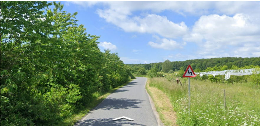
Kyse Overdrevs Vej 37 bag eksisterende læhegnsplantering (til venstre i billedet) og frugtplantage foran Harrested Skovs skovbryn set fra øst. Masten opstilles i umiddelbar tilknytning til bebyggelsen bag læhegnet til venstre i billedet, udenfor vejens point de vue. Google street view 2022.

Ejer af ejendommen Kyse Overdrevs Vej 37 har været positiv overfor opførelse af en antennemast i umiddelbar tilknytning til de eksisterende driftsbygninger. Der er gode pladsforhold og tilkørselsforhold ad eksisterende indkørsel, så det er ikke nødvendigt at etablere ny overkørsel.