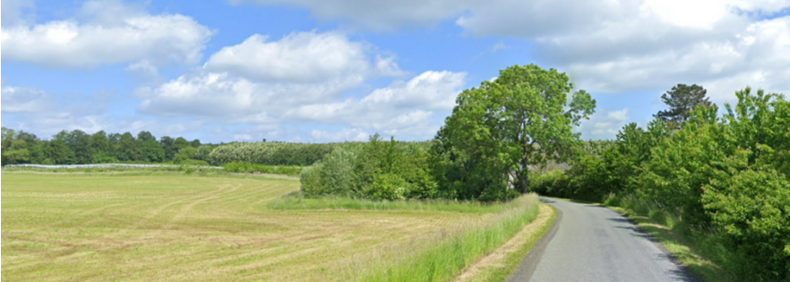
Kyse Overdrevs Vej 37 bag eksisterende læhegnsplantering (til højre i billedet) og det åbne landskab foran Harrested Skovs skovbryn set fra syd. Masten opstilles i kanten af billedet, udenfor vejens point de vue. Google street view 2022.