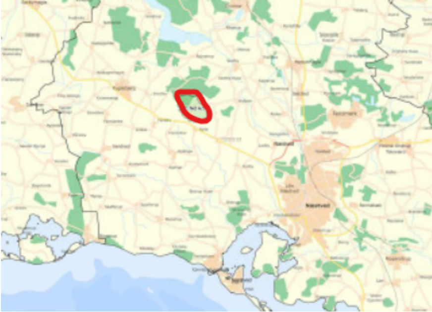
Kortbilag fra Energistyrelsen, der viser placeringen af det område ved Kyse Overdrev i Næstved Kommune, der er pålagt dækningskrav for forbedret mobildækning

Sitehunter KPR Towers A/S har på vegne af TDC NET A/S afsøgt området for den bedste mulige placering af antennepaneler.