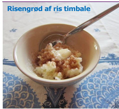
Risengrød (ris timbale) med kanelsukker og smørklut på

Blød/saftig/våd konsistens. Naturligt eller tilberedt, så maden har en blød konsistens, dvs. maden koges, dampes eller bages (uden skorpe). Maden skal være let at dele over eller at mose med en gaffel.