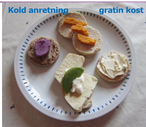
Gratinrugbrød med leverpostej m/rødbedegratin, fiskegratin m/mayonnaise og broccoligratin, frikadellegratin m/gulerodsgatin, gratinfranskbrød med flødeost

Det er vigtigt, at få tre hovedmåltider dagligt - og 3-5 små måltider ind i mellem, for at sikre et stort nok energiindtag over dagen. Mad og drikke må ikke indtages liggende eller tilbagelænet grundet risiko for fejlsynkning, og der skal