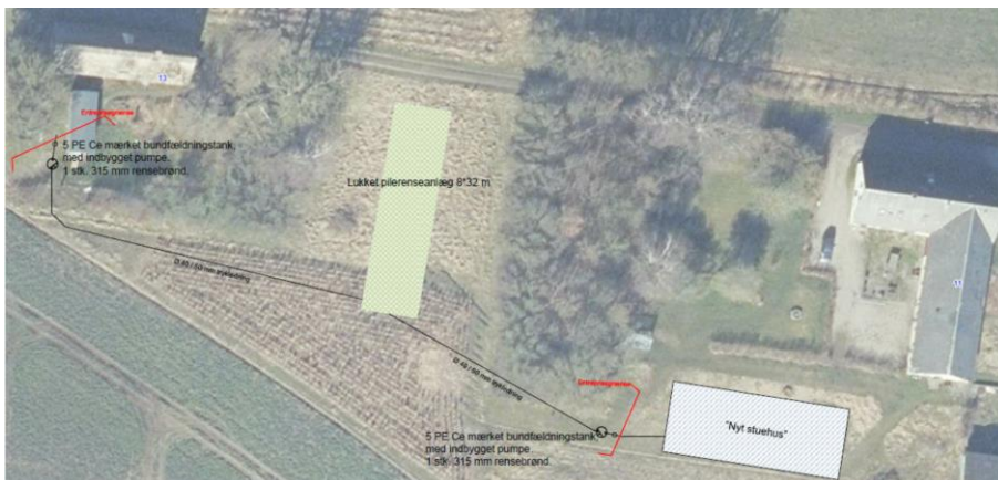
Situationsplan fra ansøgningsmaterialet.

Materialer og placering fremgår nedenfor. Bemærk at der ved en fejl står 8 m x 32 m flere steder på disse tegninger/beskrivelser. De rigtige dimensioneringsmål er 8 m x 35 m: