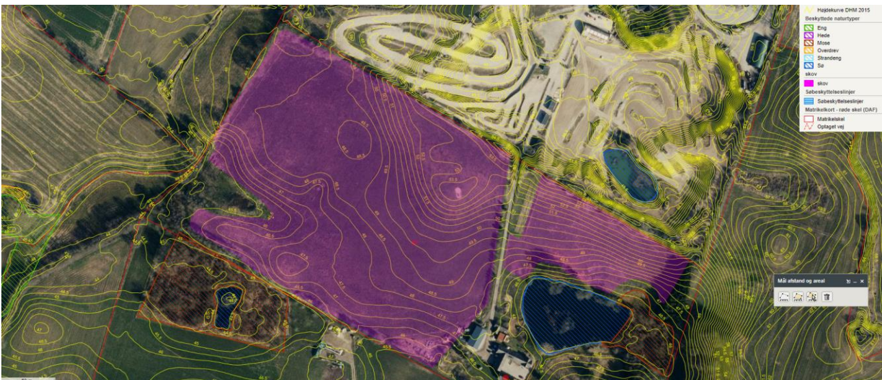
Ansøgt skovrejsning og omkringliggende natur

Skovrejsningen ønskes på let skrånende område, hvor terræn mod nordøst ligger højt og sydvest lavere. Den er delt i to områder adskilt af ejendommens adgangsvej og etableres på mark i omdrift. Op til de to områder er motorbanen "Nisseringen", have, mark, vej, sø og mose. Hele området, skoven ønskes placeret i, er registreret som "bevaringsværdigt landskab", en mindre del mod sydvest som "Grøn forbindelse", en anden mindre del mod vest som "lavbundsareal, der kan genoprettes" og endelig en mindre del mod øst som "Potentielt naturområde". Skovrejsningen er ikke i konflikt med nogle af disse udpegninger.