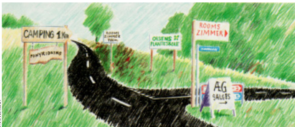
Ikke kaos eller store reklamer i det åbne land