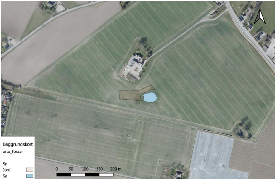
Kortbilag fra ansøgningsmaterialet, der viser søens placering og areal til udlægning af opgravet jord.