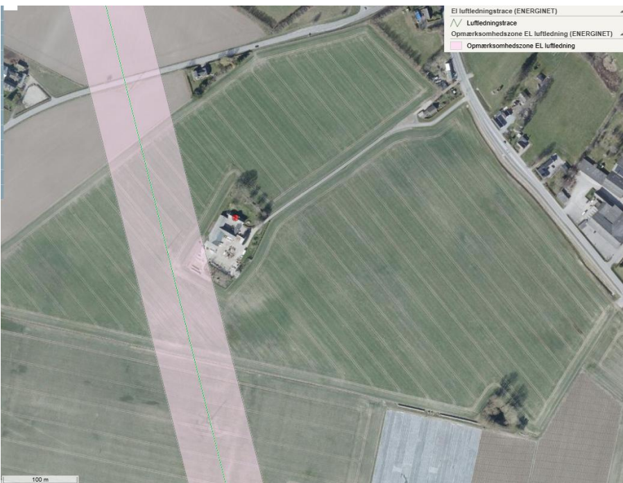
Kort, der viser el-luftledningstraceet og opmærksomhedszonen for el-luftledning i området. Opmærksomhedszonen er vist som et gennemsigtigt felt omkring traceet.