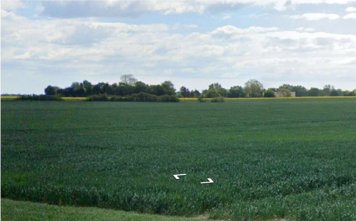
Foto 3. Fotoet er taget fra det blå område af Langetoftevej, som ses på oversigtskortet fra synlighedsberegningen, nord for skydebanen og bygningsanlægget til Langetoftevej 10, 4700 Næstved.

Ifølge synlighedsberegningen vil i det mindste den øverste ene meter af en eller flere af støjskærmene kunne ses fra stedet, hvor foto 3 er taget. Skydebanen er beliggende ca. i midten af foto 3. Det er ikke muligt på fotoet at identificere et af de lavere maskinhuse på skydebanen.