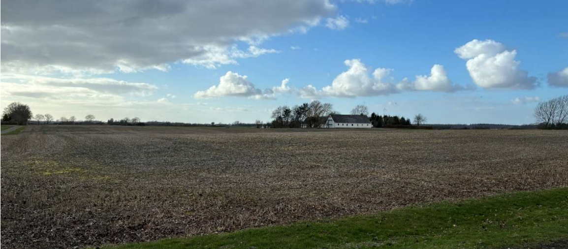
Foto 1, af 26. marts 2026. Fotoet er taget fra det blå område af Langetoftevej, som ses på oversigtskortet fra synlighedsberegningen, øst for skydebanen og bygningsanlægget til Langetoftevej 10, 4700 Næstved. Fotoet er ikke zoomet ind til det, øjet ser på stedet.