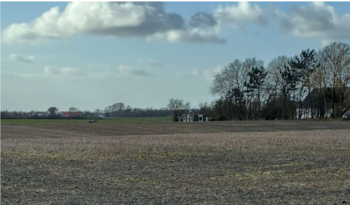
Foto 2, af 26. marts 2026. Det er taget fra samme sted på Langetoftevej som foto. 1. Fotoet er zoomet ind til omtrent det, øjet ser på stedet. Klubhuset til Hyllinge Jagtforenings flugtskydebane ses ca. midt i fotoet. Skydebanen ligger umiddelbart vest for klubhuset. På fotoet kan ses et maskinhus omtrent mellem klubhuset og fotoets venstre kant.