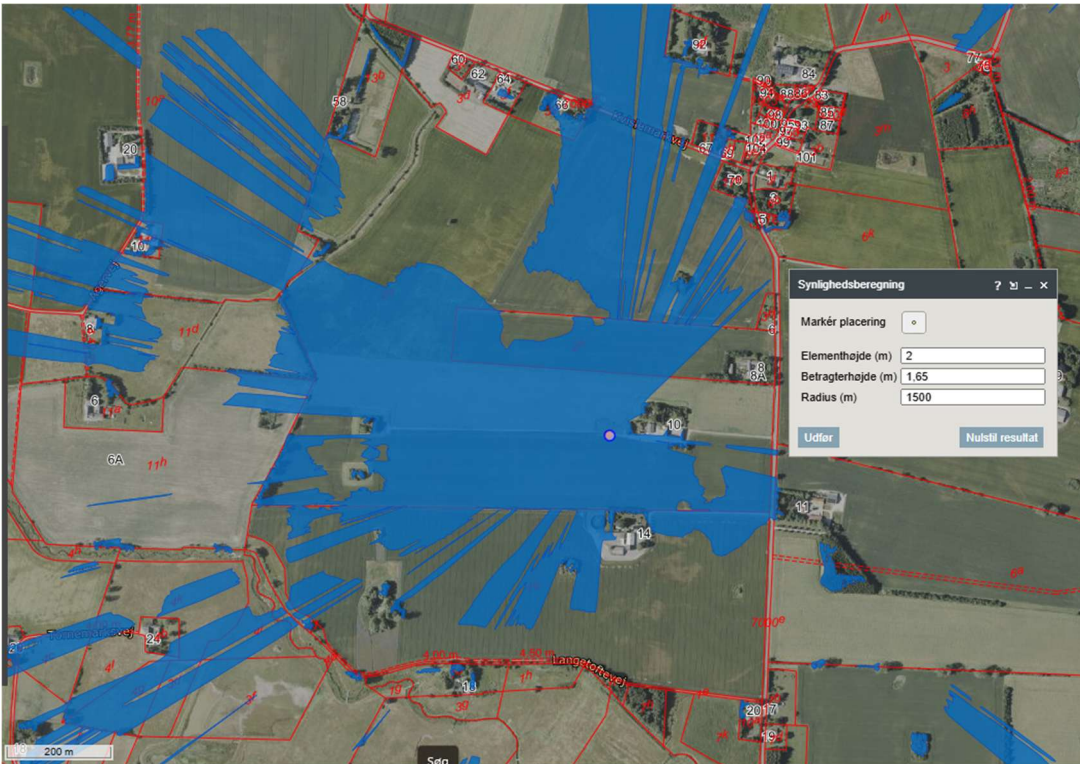
Oversigtskort fra synlighedsberegningen i gis.

Synlighedsberegningen viser på ovenstående oversigtskort, at man fra de blå arealer, i en øjenhøjde af 1,65 meter og indenfor 1,5 km fra skydebanen, i det mindst vil kunne se den øverste ene meter af en eller flere af støjskærmene på skydebanen. Beregningen skal tages med lidt forbehold, bl.a. fordi beregningen ikke gør forskel på, om betragterhøjden er 1,65 meter fra terræn og vej, eller det er på toppen af et hustag eller beplantning.