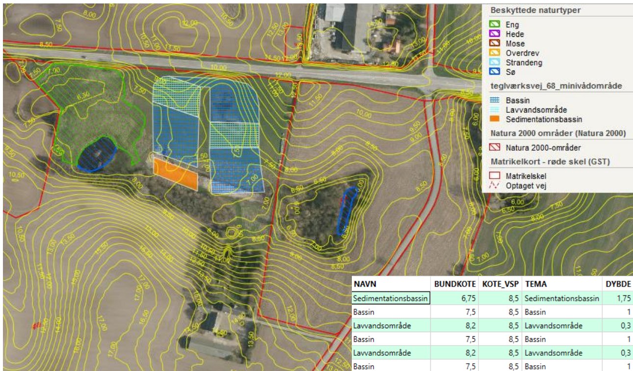
Orthofoto med matrikelskel, eksisterende højdekurver, natur og anlæggets hovedelementer (sedimentationsbassin, bassiner og lavvandsområder).