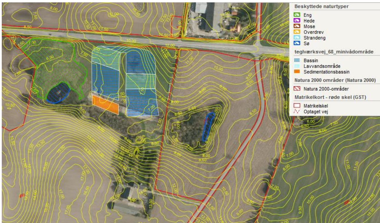
Orthofoto med matrikelskel, eksisterende højdekurver, natur og anlæggets hovedelementer (sedimentationsbassin, bassiner og lavvandsområder).

Minivådområdet får et vandfladeareal på 1,19 ha og et samlet areal med diger 1,7 ha. Hertil kommer pumpereservoir og iltningstrappe.